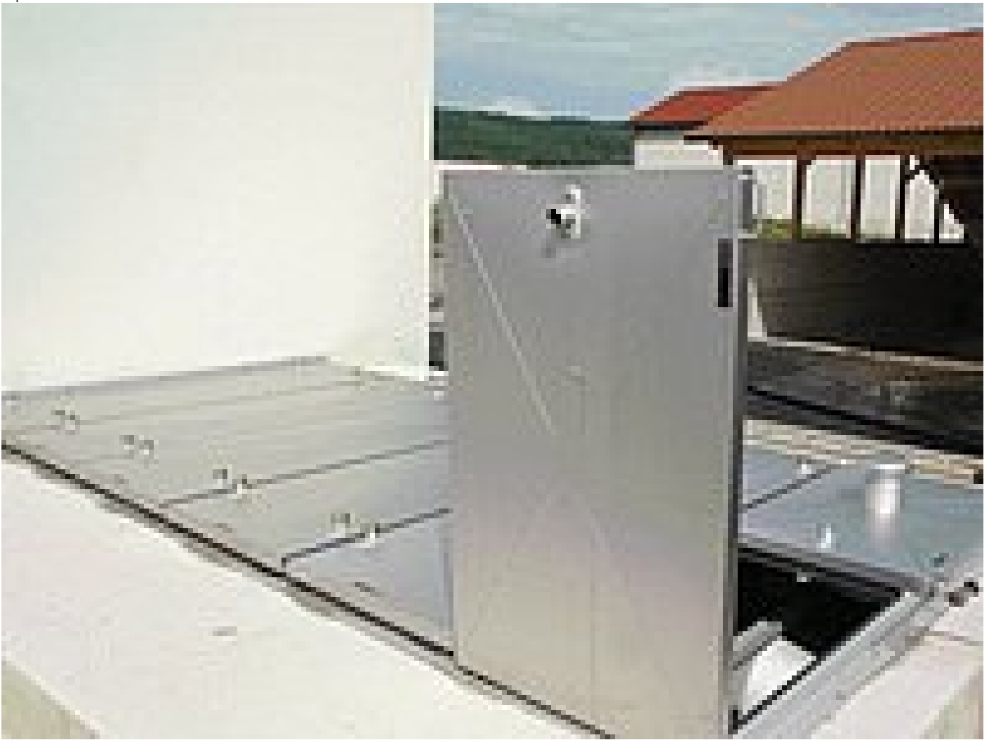
Sonderschachtabdeckung zur Sicherung von Schächten

Um auf Kläranlagen und bei der Bedienung von Maschinen für eine optimale Sicherheit und den Schutz der Bediener und Beschäftigten zu sorgen, müssen Vorschriften für Treppen und Geländer bereits bei der Planung und natürlich auch bei der Ausführung der einzelnen Elemente berücksichtigt werden.