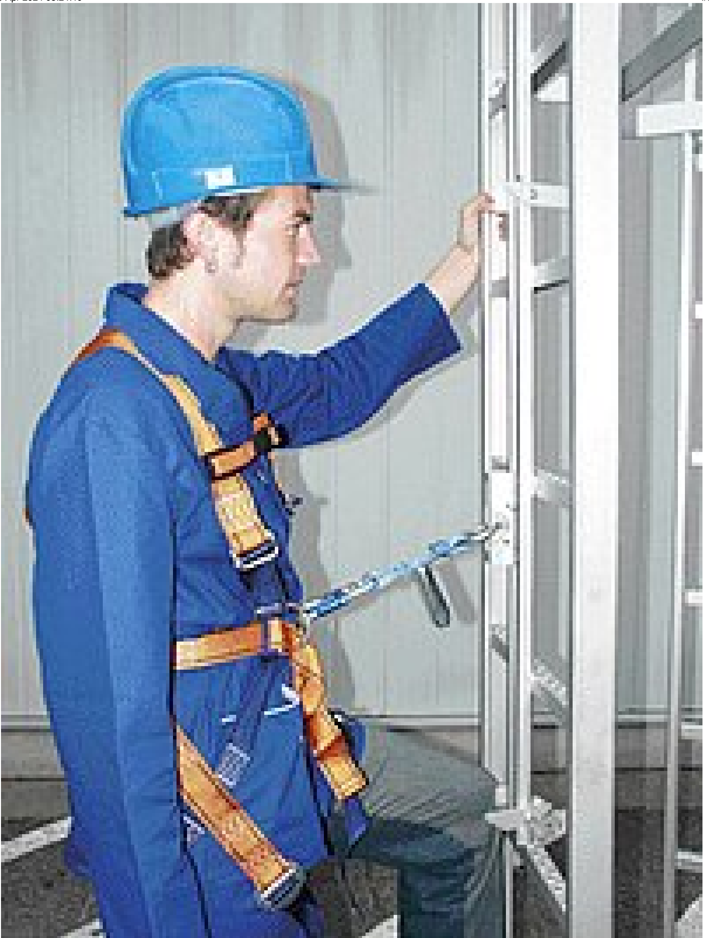
Fallschutzschiene mit Läufer und Bandfalldämpfer