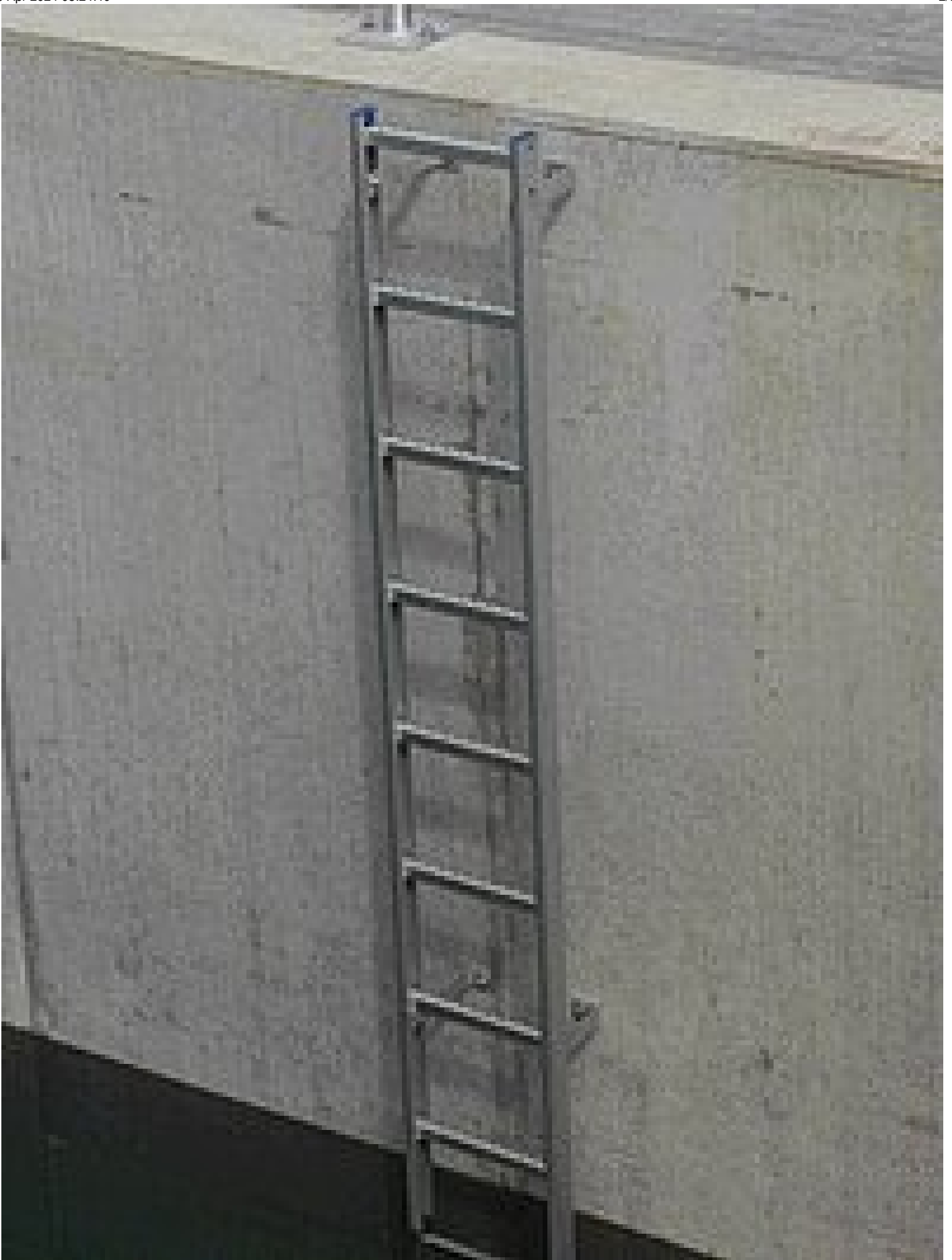
Sicherheitssteigleiter mit rutschhemmenden Sprossen