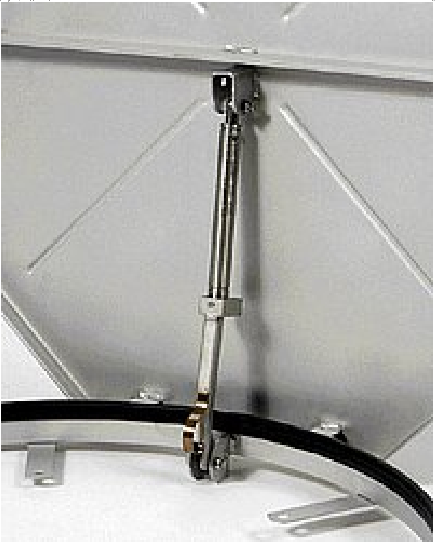
HUBER Edelstahl Gasdruckfeder mit Aufhaltevorrichtung