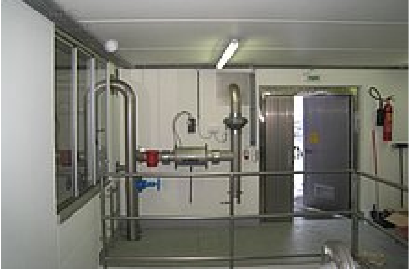
Utzenaich: In Strömungsrichtung nacheinander: Wandanschlussplatte innerhalb der Sicherheitsjalousie (außen, nicht abgebildet), Luftansaugleitung zum Radial-Rohrventilator mit 5-stufigem Trafo zur Drehzahlverstellung, Luftfilteranlage L251 (oberhalb der zugehörige Differenzdruckschalter), Sicherheitsventil Typ 170-1 (rot, ca. 1.000 Pa Auslösedruck)

Im Hochbehälter Utzenaich wurde der erste erfolgreiche Versuch gemacht, die Kondensatbildung durch Zwangsbelüftung zu eliminieren. In den folgenden Jahren wurden weitere Behälter mit einer Zwangsbelüftung zusätzlich zu bereits vorhandenen Luftfiltern eingebaut. Überall konnte die Kondensatbildung minimiert werden. Ein weiterer Vorteil dieser Maßnahme ist, dass sich ab dem Ventilator das gesamte System in einem leichten Überdruck befindet und mit Sicherheit keine ungefilterte Luft in die Wasserkammer